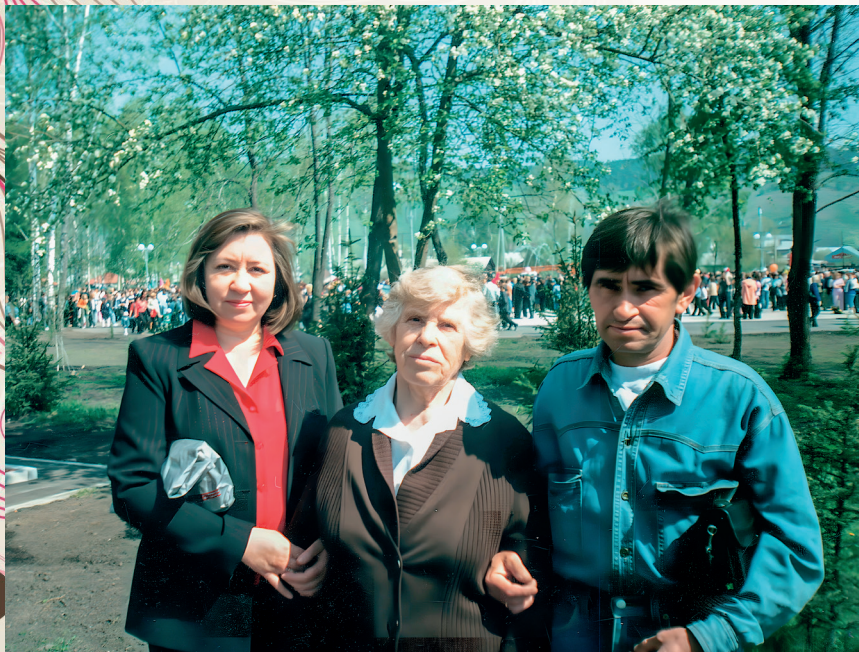
На праздновании 9 мая