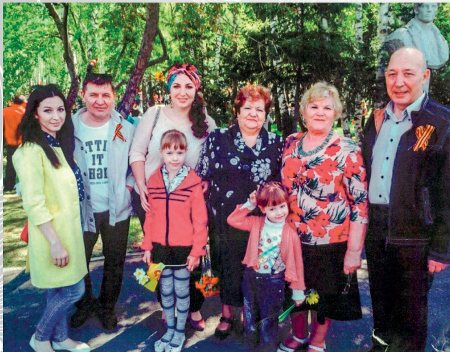
В День Победы