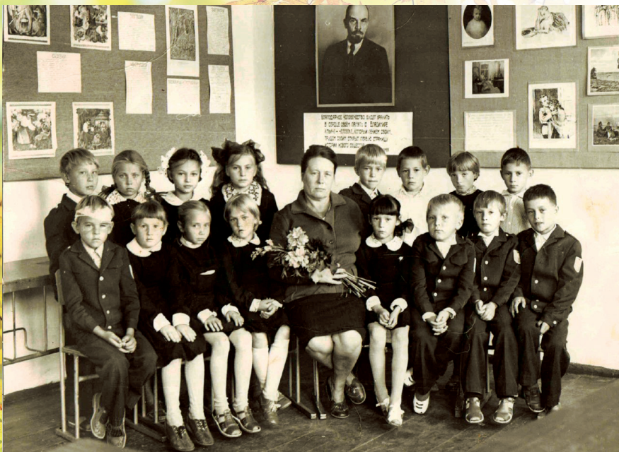
С любимым классом