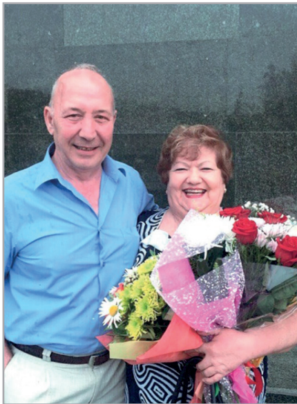
С любимой супругой