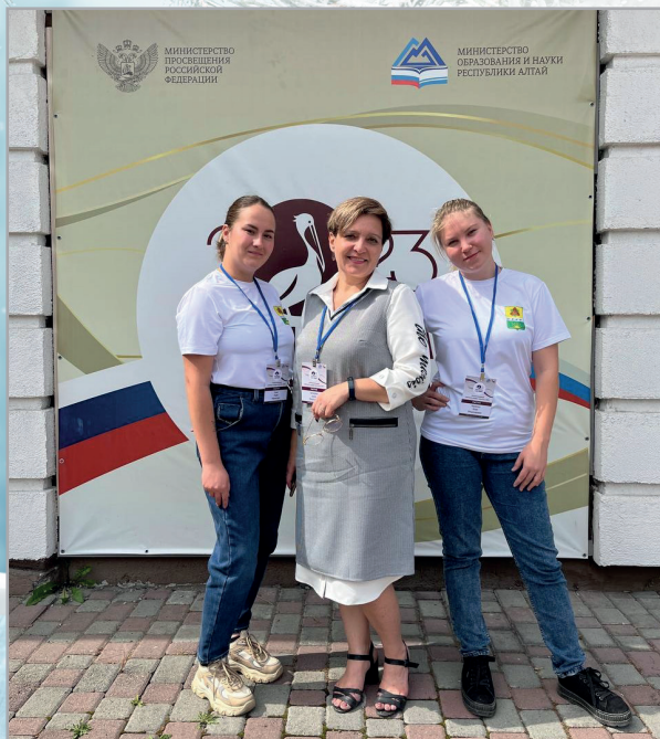
На Чемпионате молодых педагогов