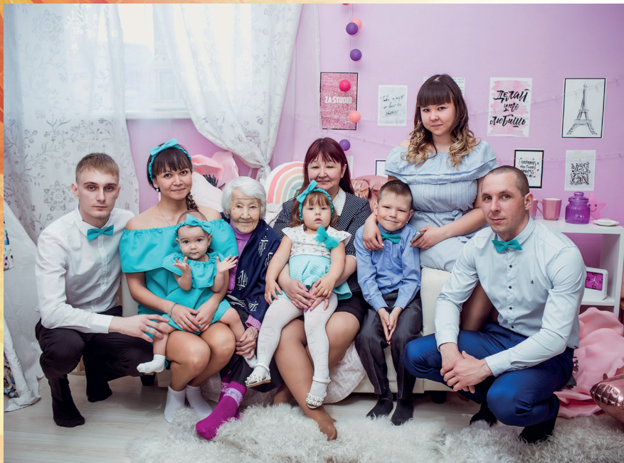
На семейном празднике